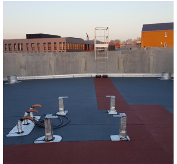
LOGEMENTS - LIEUSAIN (77) Chemin technique et réservations