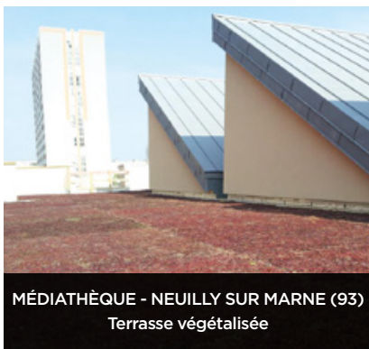
MÉDIATHÈQUE - NEUILLY SUR MARNE (93) Terrasse végétalisée