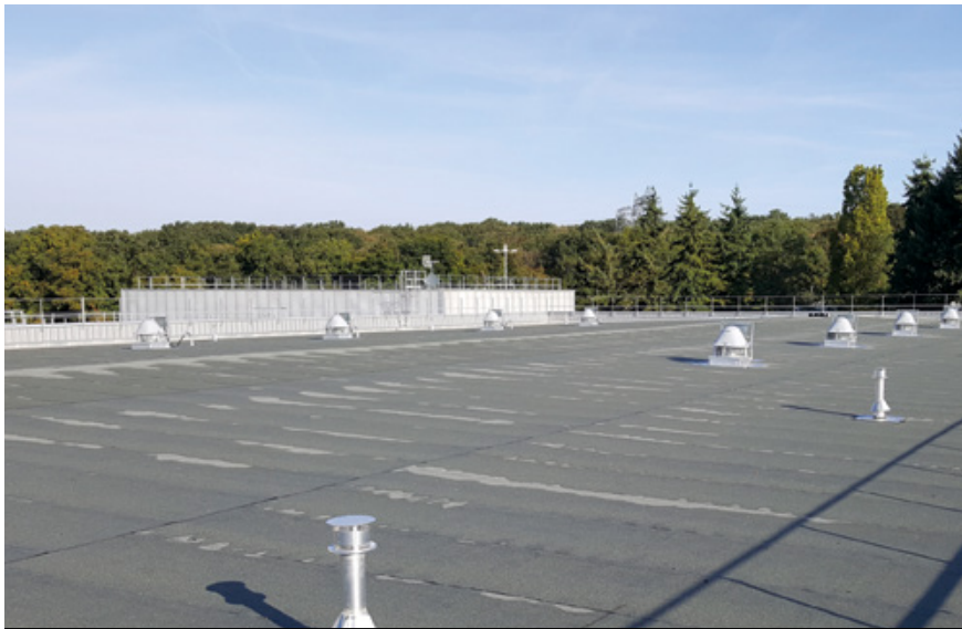
SDIS - MELUN (77) Étanchéité bitumineuse