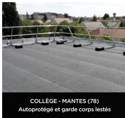
COLLÈGE - MANTES (78) Autoprotégé et garde corps lestés