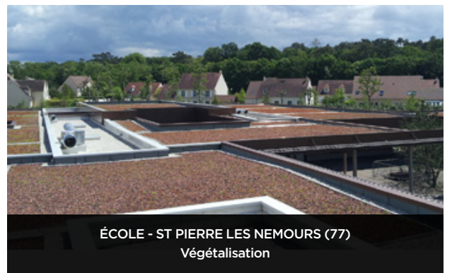
ÉCOLE - ST PIERRE LES NEMOURS (77) Végétalisation