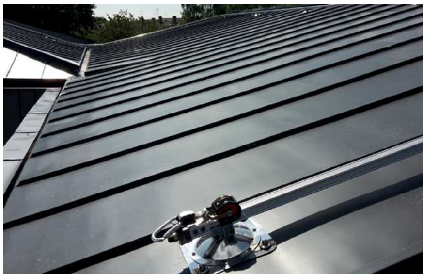
ÉCOLE AMSTERDAM - ELANCOURT (78) Couverture zinc à joint debout