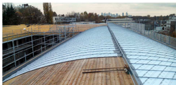
LOGEMENTS - ST CLOUD (92) Couverture cintrée en zinc à joint debout