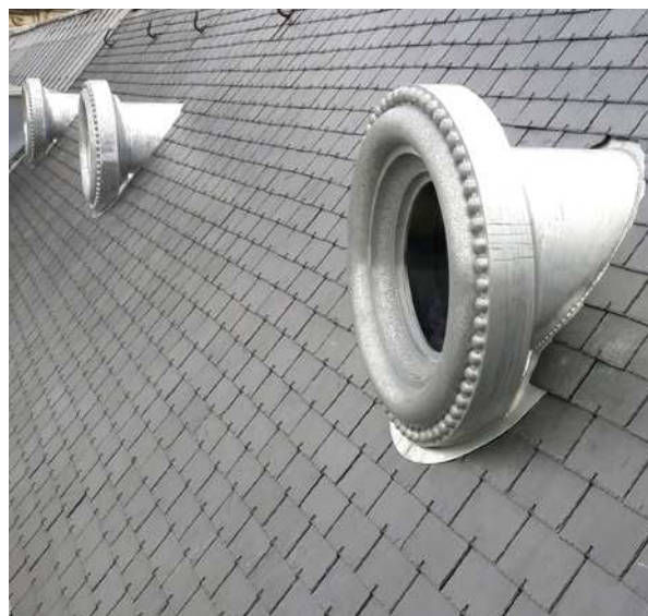
GARE D'AUSTERLITZ - PARIS (75) Couverture ardoise et ornements en zinc