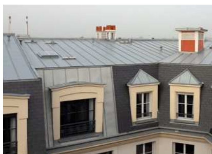
LOGEMENTS - MAISON ALFORT (94) Couverture Mansard, ardoise et zinc