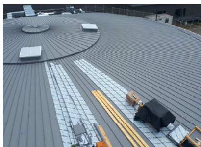
INTERSPORT - LONGJUMEAU (91) Couverture rayonnante en zinc