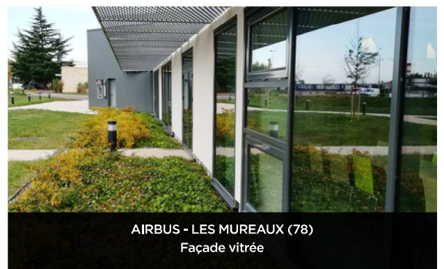
AIRBUS - LES MUREAUX (78) Façade vitrée