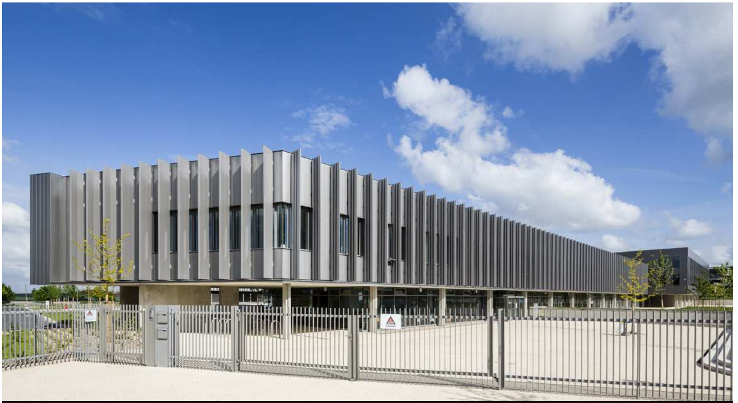
IMA CHAMBRE DES MÉTIERS ET DE L'ARTISANAT - MEAUX (77) Enveloppe du Bâtiment (mext, bardage, serrurerie, métallerie, étanchéité, clôture)