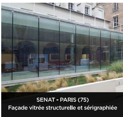
SENAT - PARIS (75) Façade vitrée structurelle et sérigraphiée