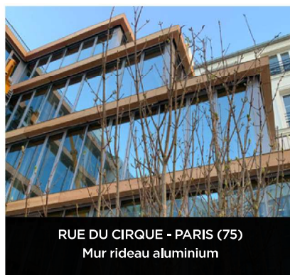
RUE DU CIRQUE - PARIS (75) Mur rideau aluminium